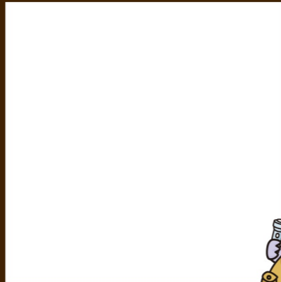
埼玉県のマスコット「コバトン」