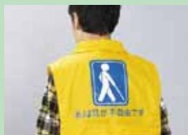
視覚障がい者用防災ベスト 東京都葛飾福祉工場