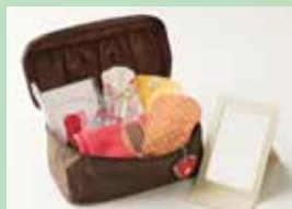
女性の防災セット '小町' 株式会社ループラス 東日本大震災の経験から生まれた女性用セット