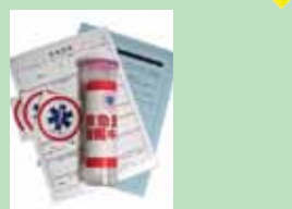
救急医療情報キット 命のボタン 株式会社CSP 高齢者や独居者のための救急時個人情報保管キット