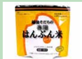
はんぶん米 有限会社エコ・ライス新潟 たんばく制限者も食べられる 長期保存可能なアルファ化米