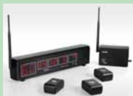
ワイヤレスコールシステム 朝日電器株式会社 福祉避難所などで呼び出し用使用する配線不要のコールシステム