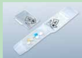
のめるモン モリモト医薬 服薬支援ゼリー