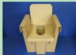
障害者・要援護者用トイレ(楽レット) 株式会社タカオカ ダンボール製の簡易トイレだが、高齢者や要介護者に配慮し、丈夫な肘掛けをセットしている