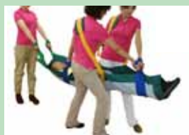
救助担架フレスト UD-001 株式会社輝章 上下移動を含む避難時、運ぶ側・運ばれる側の実情を考慮して設計された担架