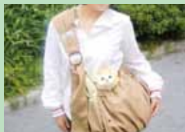
ライフバッグカジュアル サイデリアル有限公司 ペットを入れて避難するバッグと防災グッズのセット