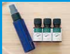
かんたんアロマスプレー作製体験