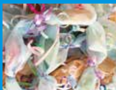
かわいいキャンディレイをつくらう!

夏の楽しいいろいろ、おやつ・飲み物・軽食を販売。レストスペース(休憩エリア)内でご飲食ください。